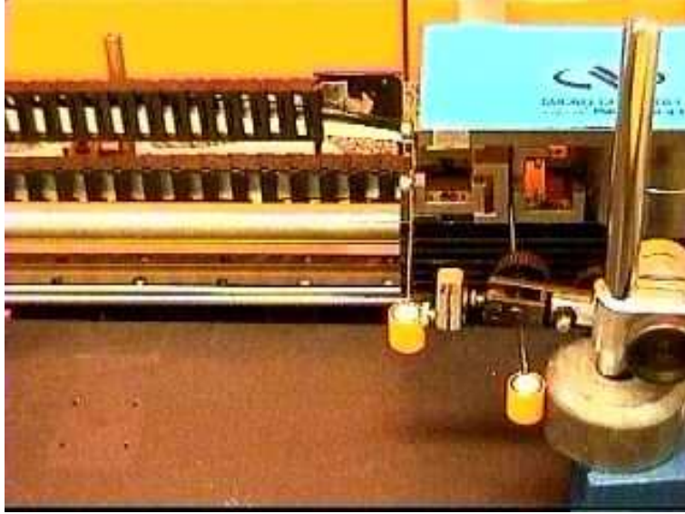
Figure 2: Deux masses reliées élastiquement à un moteur linéaire.